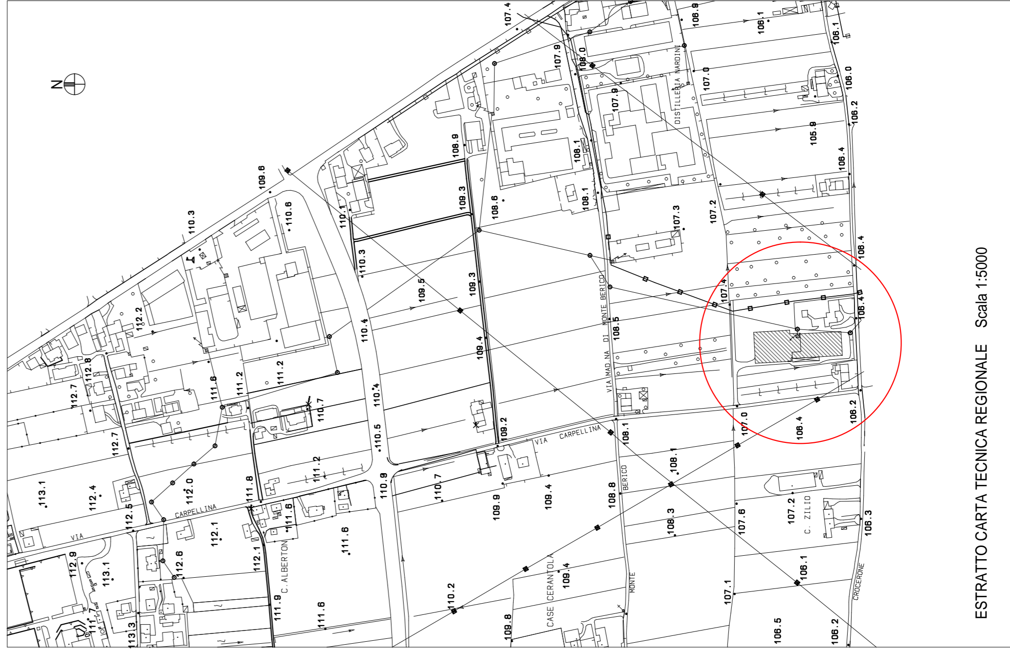
ESTRATTO CARTA TECNICA REGIONALE Scala 1:5000